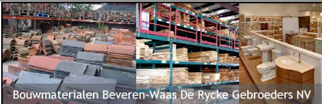
Bouwmaterialen Beveren-Waas De Rycke Gebroeders NV